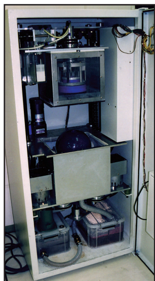
●シンプルな操作性と使う程に増す満足感