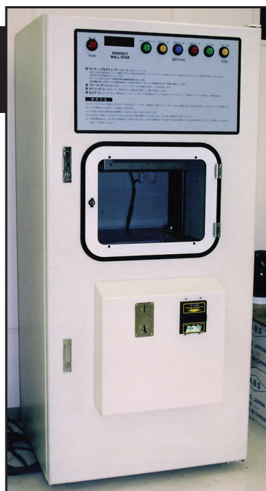
●ボール ドクターで利便性を実感