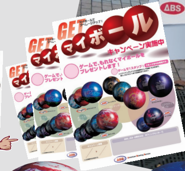
ポスターとチラシ