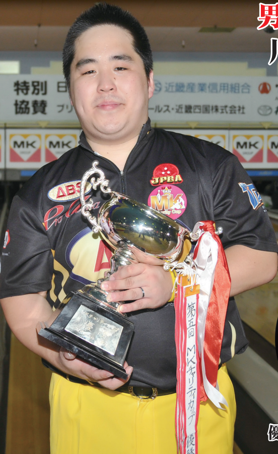
優勝ボール ランサム・デマンド