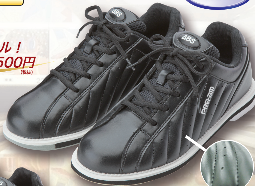
ブラック・ブラック 22.0 - 28.0cm