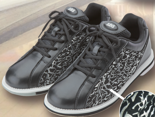
ブラック・シルバー 24.5 - 28.0cm