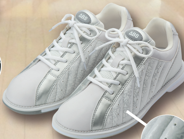
ホワイト・シルバー 20.0 - 30.0cm (左は22.0 - 28.0cm)