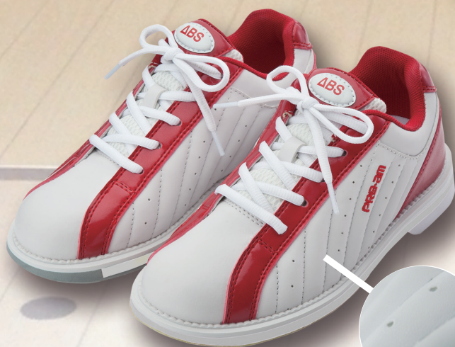
ホワイト・レッド 22.0 - 25.0cm