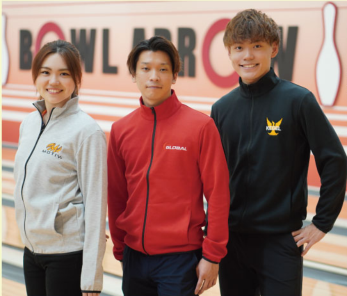
(BOWL ARROW専属) 山田 幸プロ